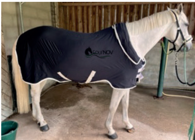
Couverture magnétique (323,38€ HT / 388€ TTC)