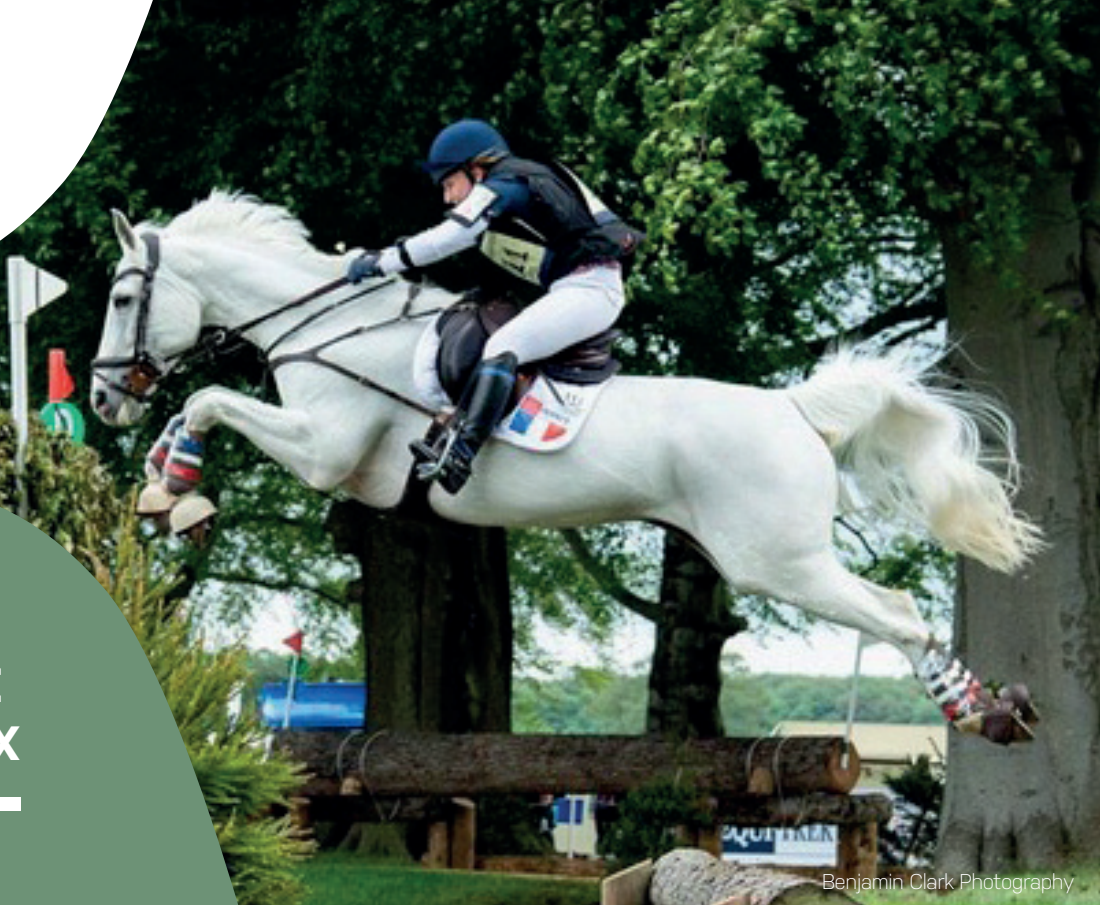
Benjamin Clark Photography