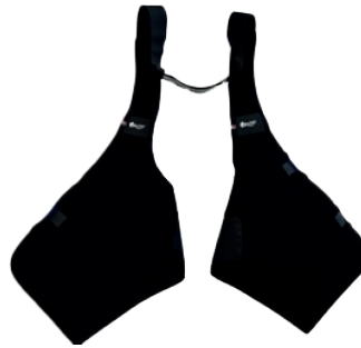
Grasset (206,67€ HT / 248€ TTC)