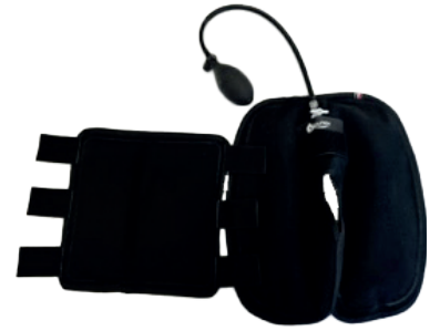
Jarret (198,33€ HT / 238€ TTC)